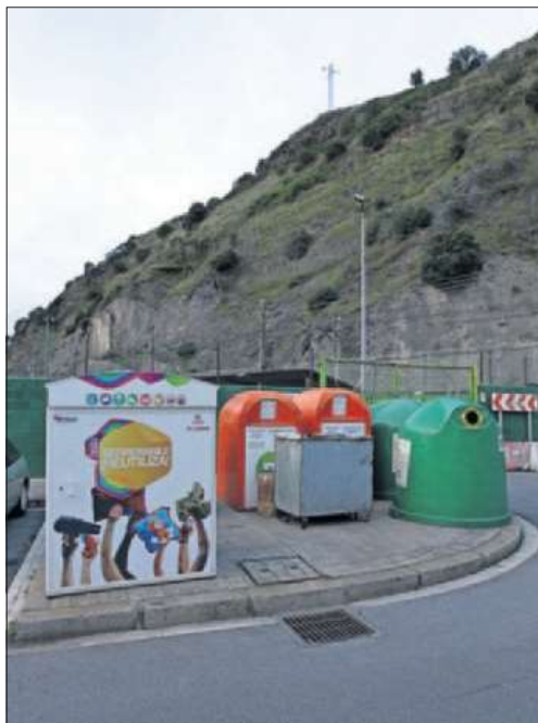
Contenedores para el reciclaje selectivo de residuos.

Para seguir por ese camino, Euskadi se convirtió en la primera región de Europa en examinar su industria para saber